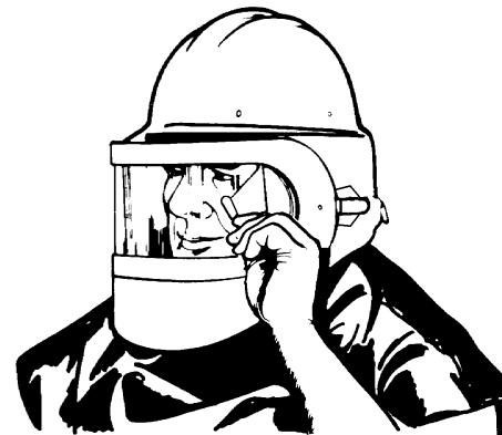
Figure 3/Figura 3